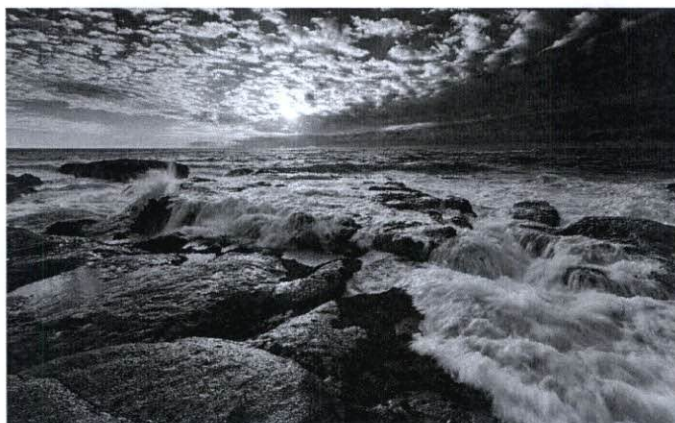
图：××××（图注文字使用五号，黑体，居中）

注：表格行列间距根据表格内容自行调整，但不允许在页边距外，表格边框线型为实线且为 0.5 磅，对于跨页的表格，需分别添加表头。